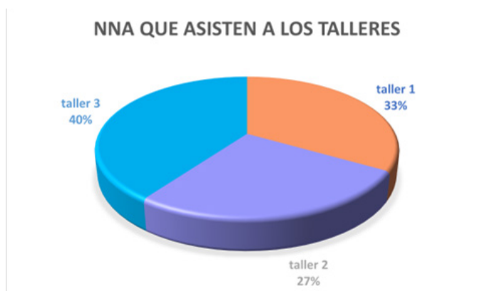
Ilustración 3 Asistencia de los niños, niñas y adolescentes a los talleres, este gráfico muestra el porcentaje de asistencia de los niños, niñas y adolescentes a los talleres realizados.

Así mismo se realizan talleres con diferente temática para fortalecer el vínculo de los niños, niñas y adolescentes con grupos poblacionales de su misma edad, así mismo se planifican y organizan talleres para la intervención con los padres y madres de los menores. Para esta investigación se realiza tres talleres para dar a conocer el valor de dar y recibir, impartir a los niños niñas y adolescentes de ser agradecidos con las cosas que tienen y no revictimizarlos.