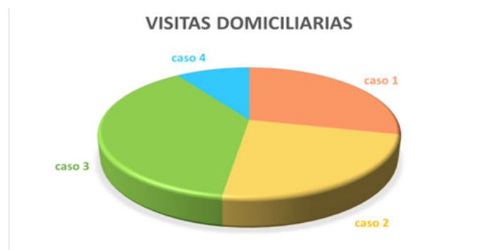
Ilustración 4 Número de visitas domiciliarias, esta figura muestra la cantidad de visitas domiciliarias realizadas a los casos en seguimiento.

Elaborado por: Equipo de Investigación, 2021.