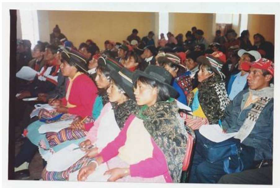
FOTO 4 POR UN MAÑANA MEJOR CAPACITACIÓN DE LAS MUJERES CAMPESINAS, YAULI – HUANCAMELICA

general “el mal rendimiento en el trabajo y el aprendizaje”; y así sucesivamente constituyendo un cuadro casi permanente y común en las familias de las comunidades de huancavelicanos, del que hay que salvarlo.