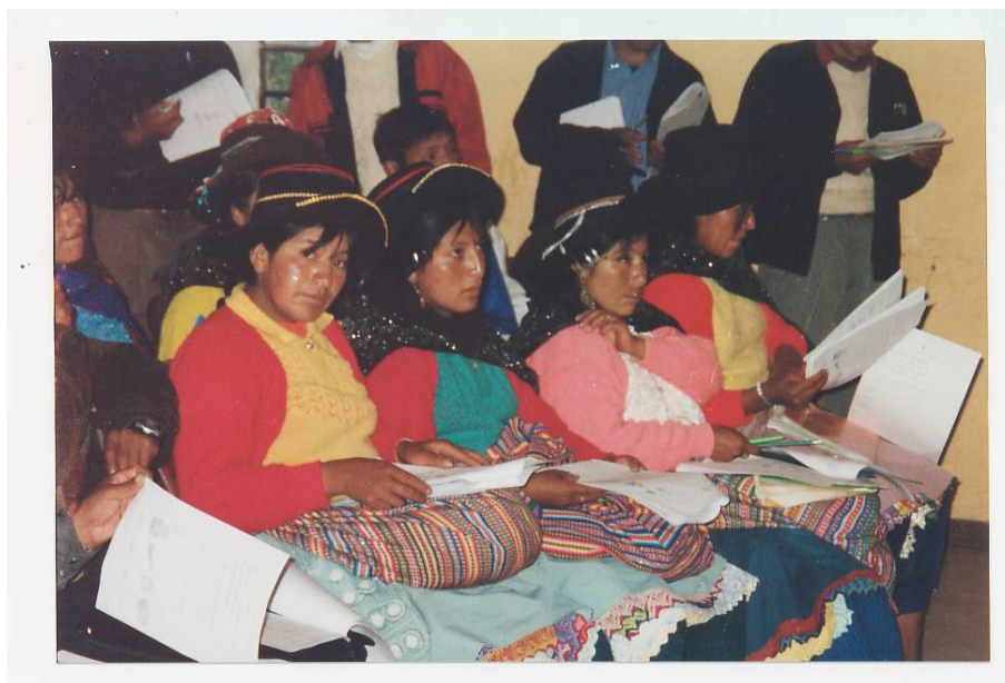
FOTO 3 EN BUSCA DE OPORTUNIDADES HOMBRES Y MUJERES DE HUANCVELICA.