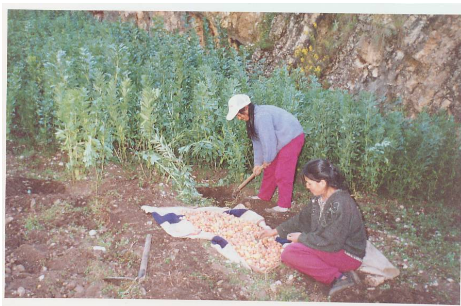
FOTO 1 LABOR COTIDIANA DE LA MUJER CAMPESINA, YAULI – HUANCAMELICA

De acuerdo a la UNESCO, (2010), la población femenina del Perú, según áreas urbanas y rurales, es de 11,108,000 personas, y de ese total el 29,2 por ciento son mujeres rurales, porcentaje que ha ido disminuyendo desde 2000, año en que equivalía al 40 por ciento. El menor número de mujeres en el campo es el resultado del sesgo industrial y urbano de los procesos de desarrollo que han caracterizado un sector agrario relativamente estancado en el cual la migración ha sido sostenida la pobreza y miseria.