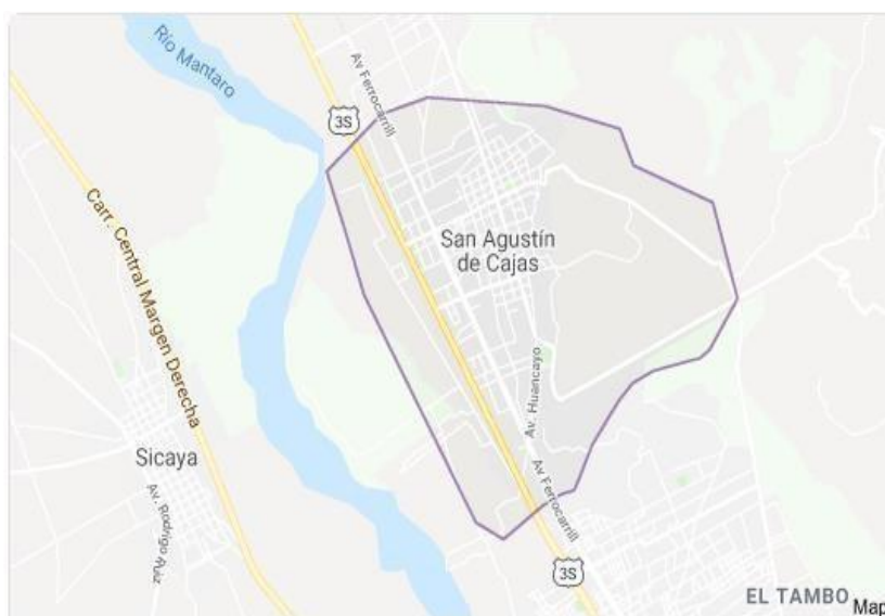
Figura 1. Mapa político del distrito de San Agustín de Cajas

La población de la investigación está constituida por los propietarios de restaurantes y hospedajes de residentes en el distrito de San Agustín de Cajas. En la figura N° 1, se aprecia el mapa del Distrito de San Agustín de Cajas.